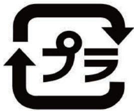
プラスチック製容器包装

本取組みは、令和4年4月に施行された「プラスチック資源循環促進法」におけるプラスチック使用製品設計指針、プラスチック使用製品産業廃棄物の排出に基くものです。