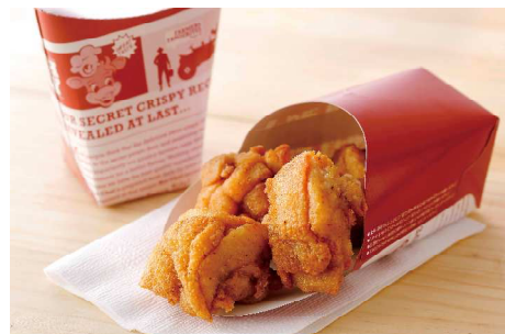
販売数NO.1の「HOT CHEF フライドチキン」