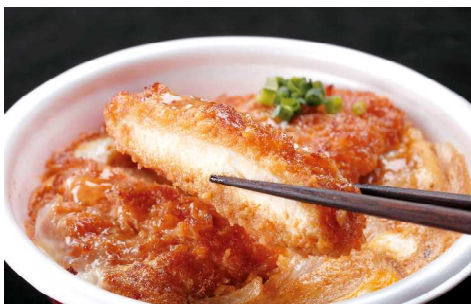
売上NO.1の「HOT CHEF カツ丼」

ホットシェフは現在北海道・関東を合わせ926店に展開するまでに成長しております。