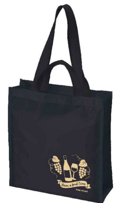
▲オリジナルエコバッグ