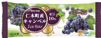
※写真はイメージです